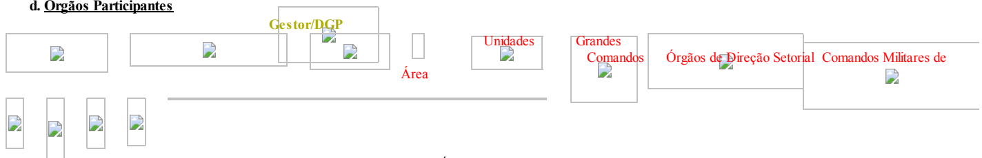
Figura 02 – Órgãos integrados e interativos no Sistema